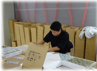
タイル製品の箱詰め作業