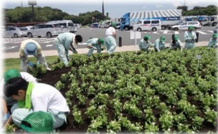
サービスエリアの公園花壇植栽