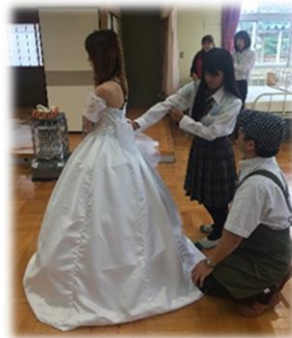
坂東市支援事業 ウエディングドレス制作