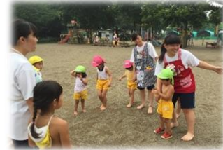
幼稚園での保育体験