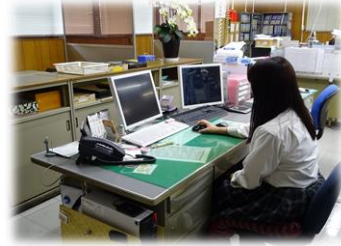
事務業務での 伝票入力作業