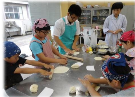
農場の食材を使ったピザづくり