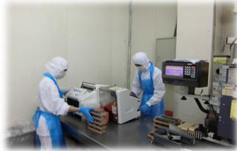
食品工場での検品作業