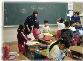
小学校での 学童保育実習